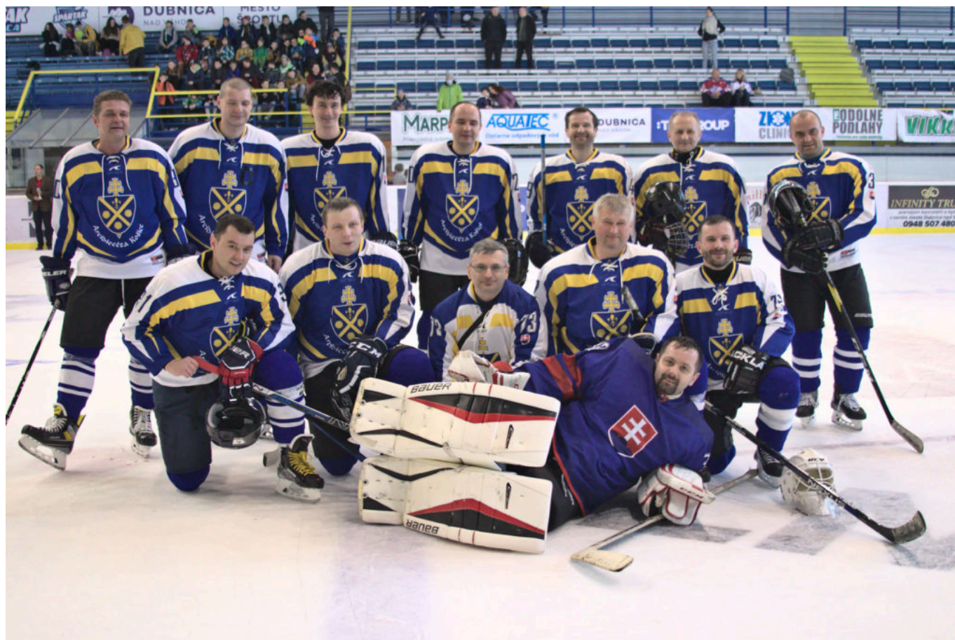
Košická arcidiecéza.

Prvá jarná sobota - hrable, turistický batoh alebo hokejky