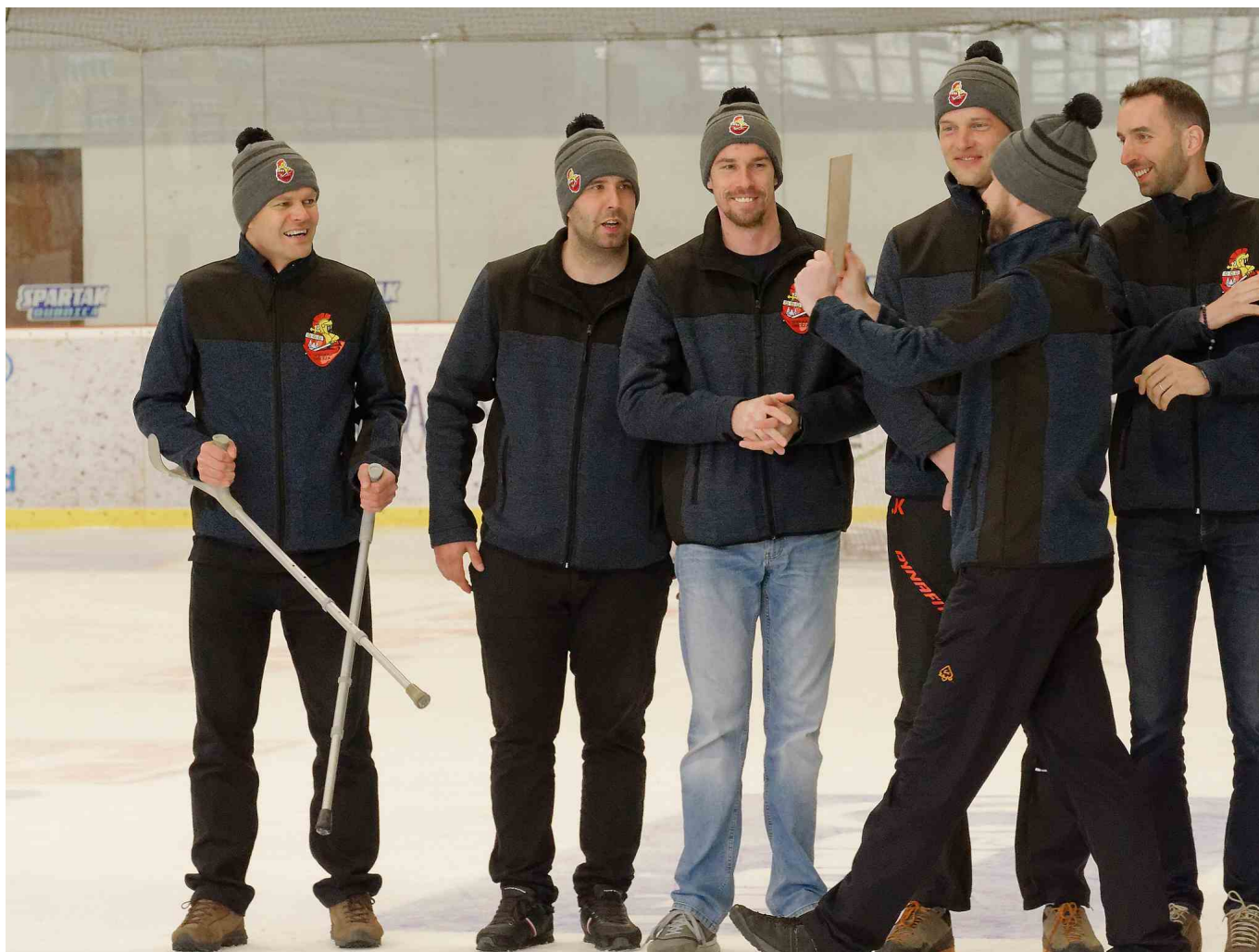
Spiš mal silnú podporu aj na lavičke. Hráč vymenil hokejky za barle po starom otcovi.