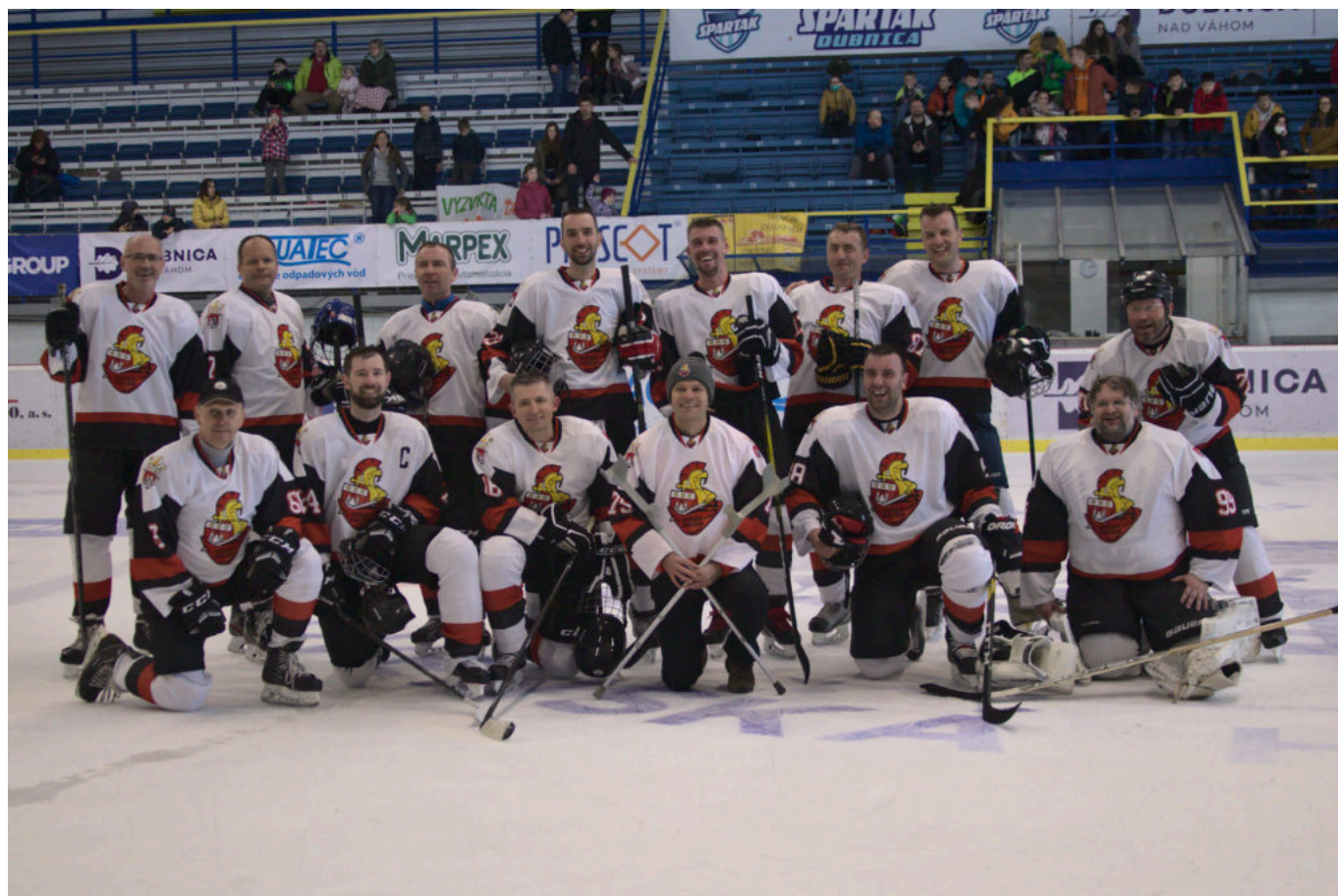
Spišská diecéza.

Prvá jarná sobota - hrable, turistický batoh alebo hokejky