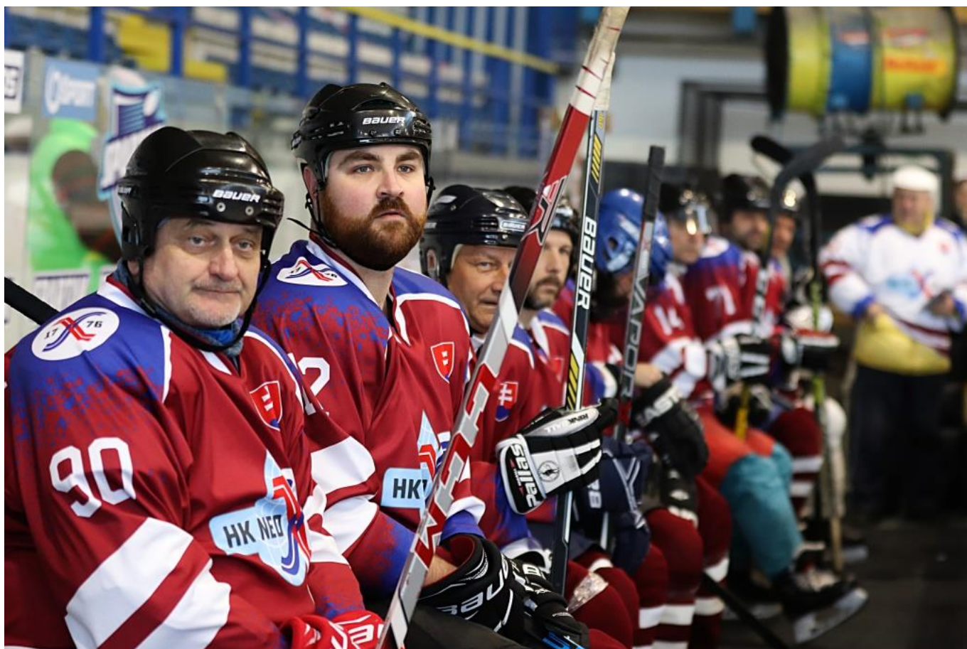
Starší páni. Vekový priemer tímu Banskej Bystrice bol 47 rokov.

Tento rok rehoľníkov v iných tímoch nehľadajte. Všetci boli tu, v oranžovo-čiernych dresoch s logom KVRPS. Po kapitánovi v abecednom poradí: