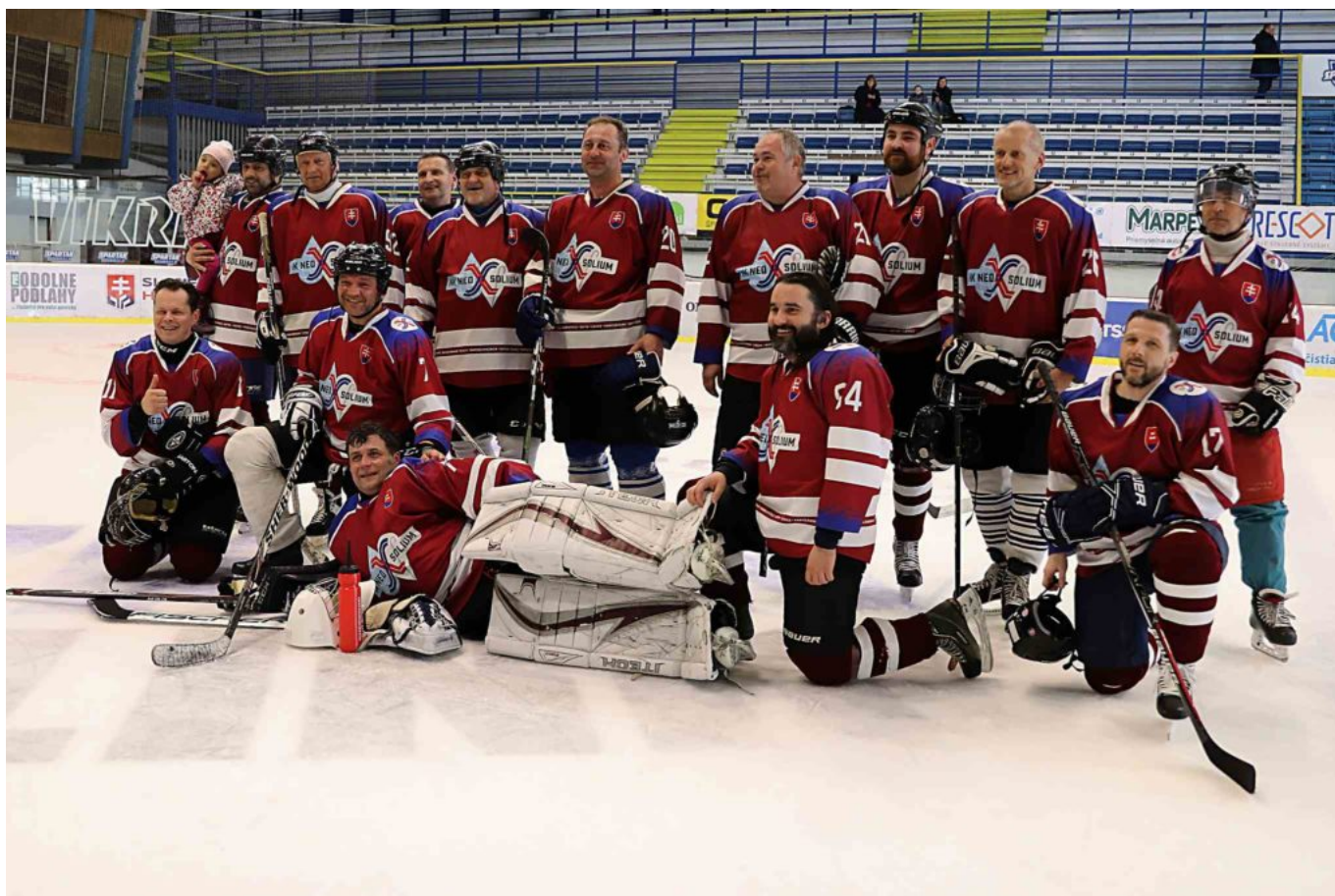
Banskobystrická diecéza.