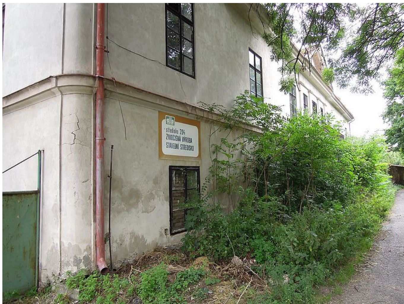
Jeden z objektů v novém areálu.