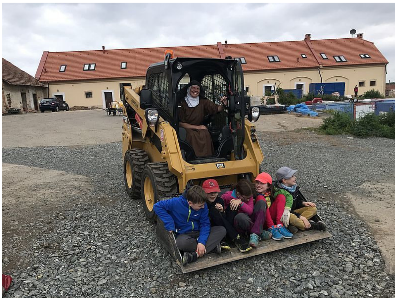
Sestry v nové roli.

Karmelitka řídící traktor? Jak by ne, když se právě staví nový klášter!