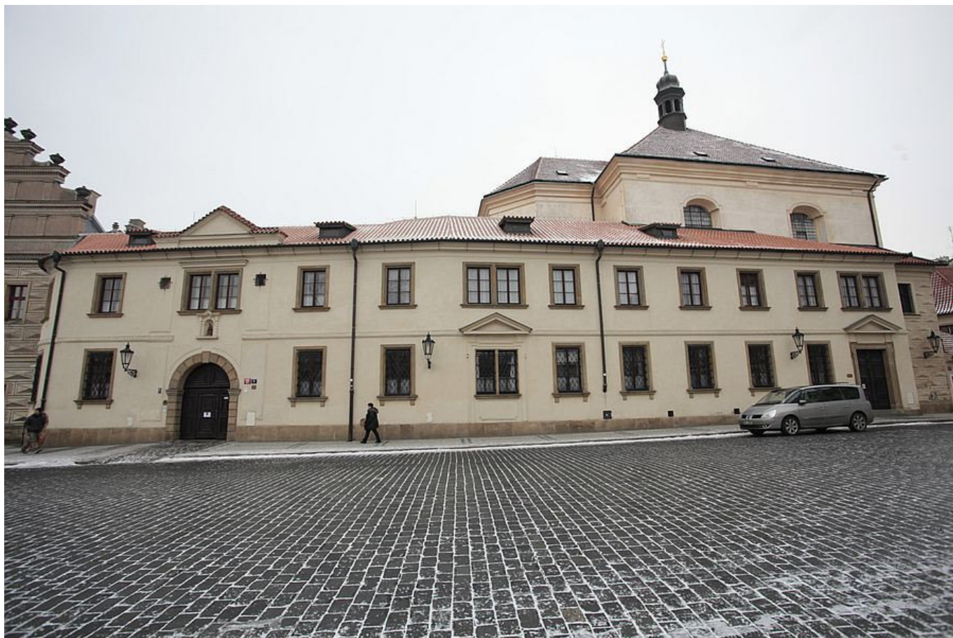
Původní klášter na Hradčanech.

Karmelitka řídící traktor? Jak by ne, když se právě staví nový klášter!