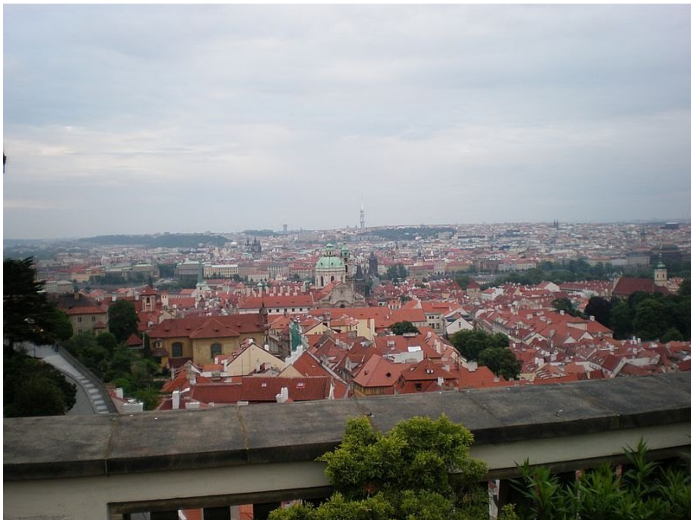
Výhled z původního kláštera.

Karmelitka řídící traktor? Jak by ne, když se právě staví nový klášter!