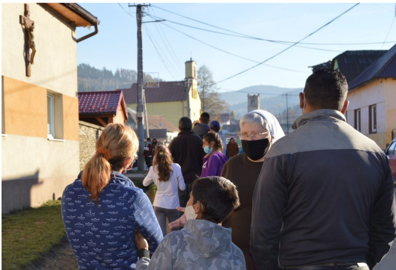
• OSF Lomnička