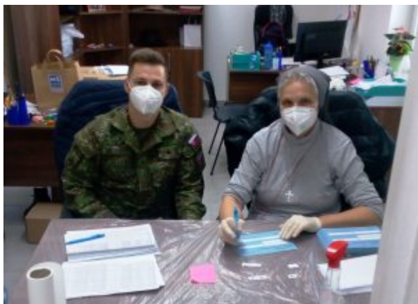
FMA Nitra - Orechov dvor