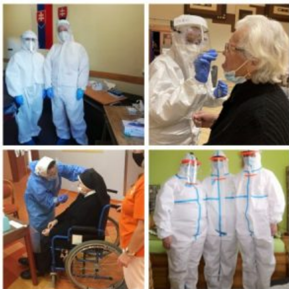
Congregatio Jesu dobrovoľníčky