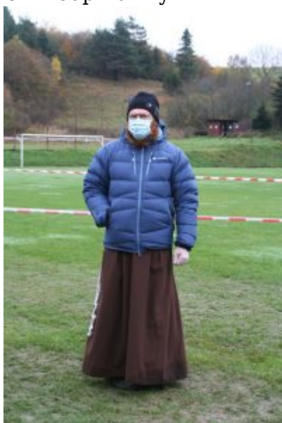
OFM Cap Poniky