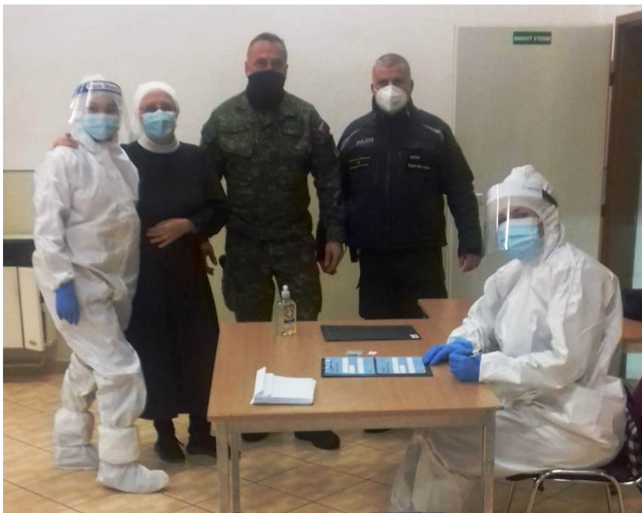
• CSC Bytča

Testovanie na niekoľko dní zjednotilo habit slovenských rehoľníkov