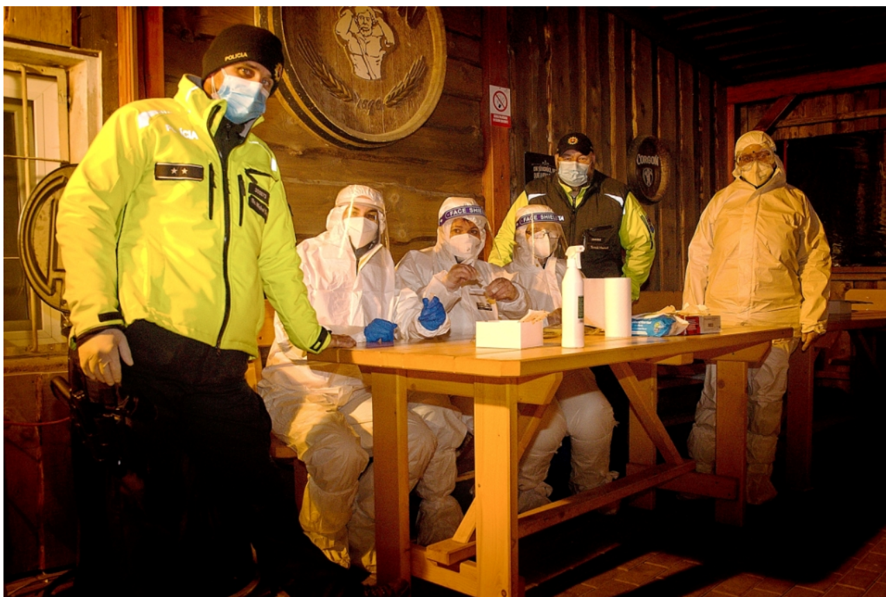
SMVS L. Mikuláš

Testovanie na niekoľko dní zjednotilo habit slovenských rehoľníkov