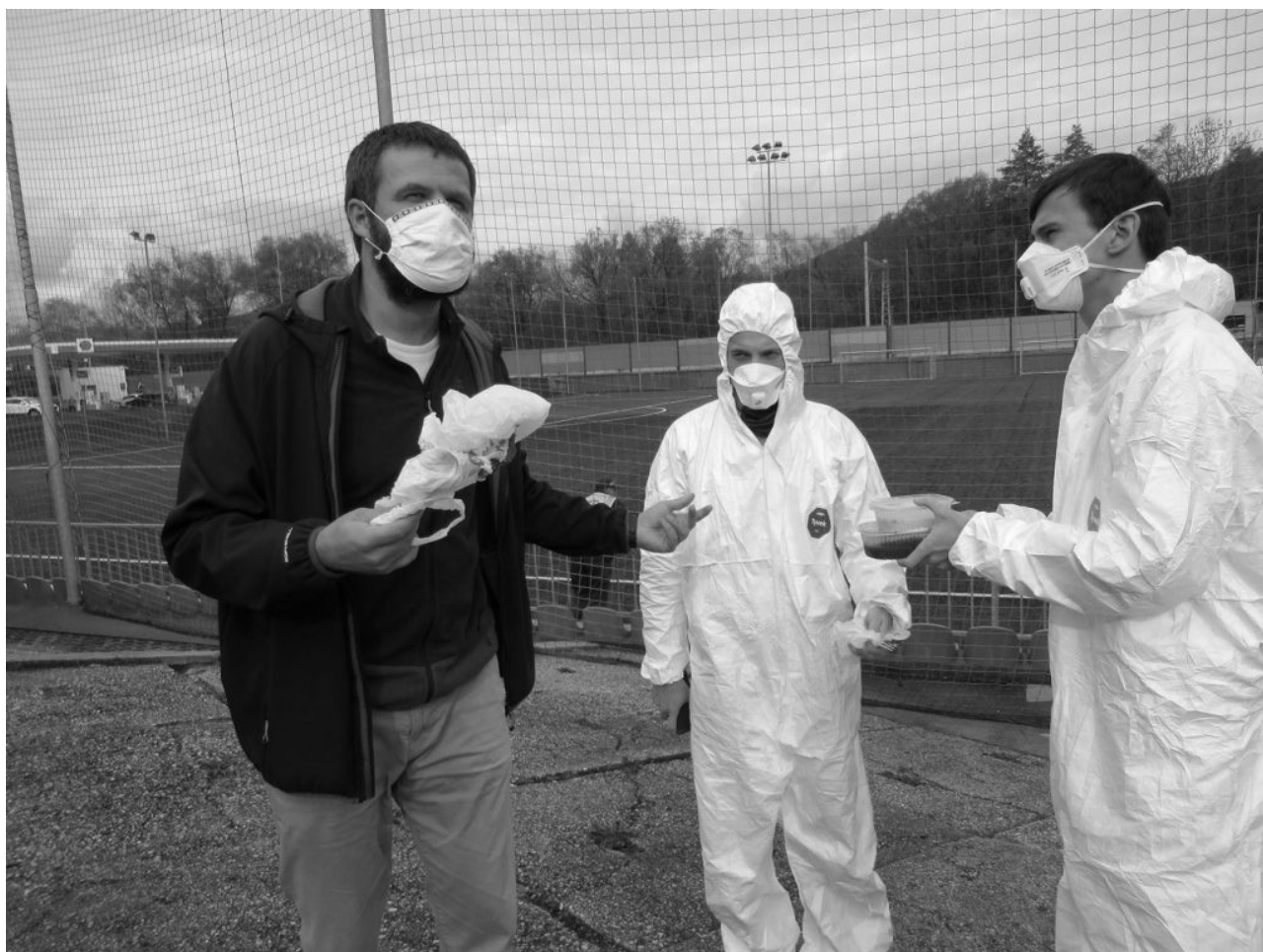
• SDB Žilina