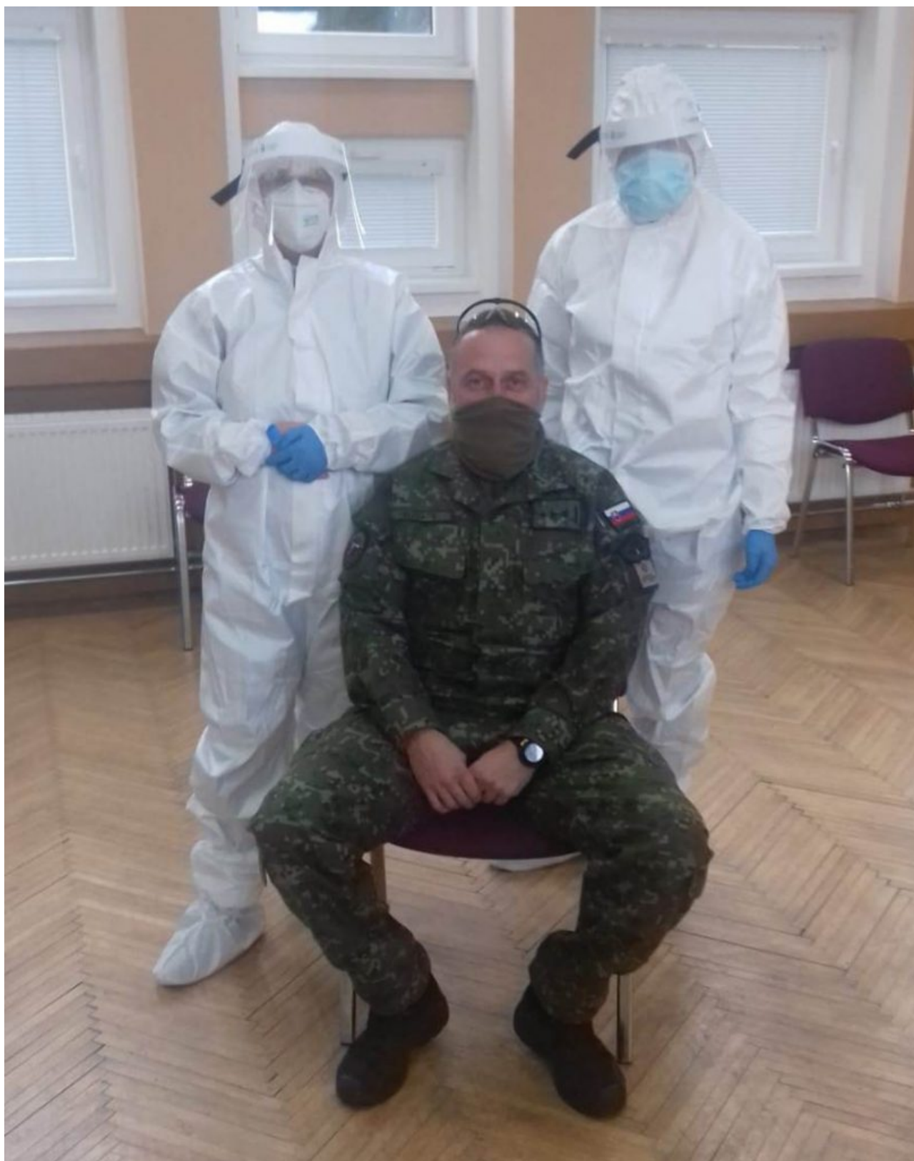
• CSC Kežmarok

Testovanie na niekoľko dní zjednotilo habit slovenských rehoľníkov