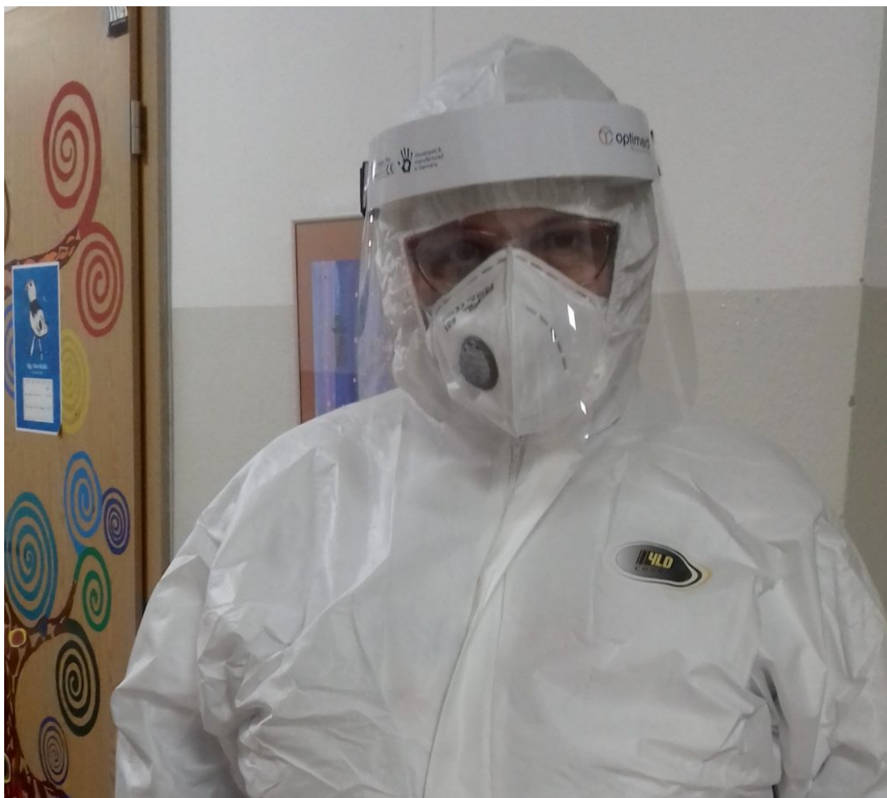
• DKL Nitra

Testovanie na niekoľko dní zjednotilo habit slovenských rehoľníkov