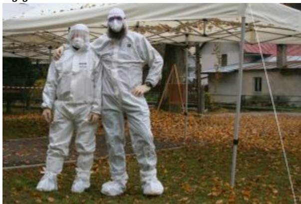
OFM Cap Poniky