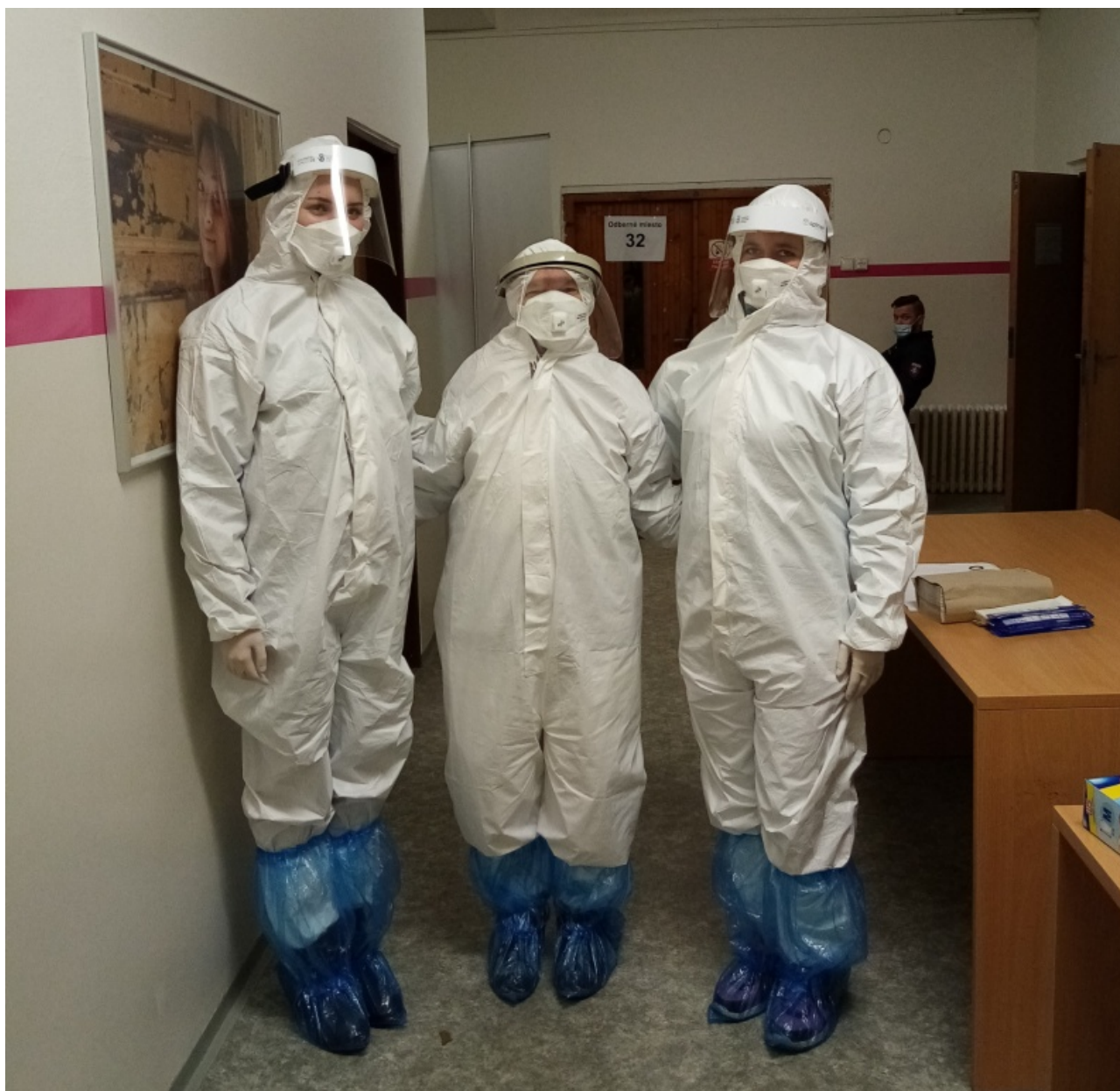
• SCSC Ružomberok

Testovanie na niekoľko dní zjednotilo habit slovenských rehoľníkov