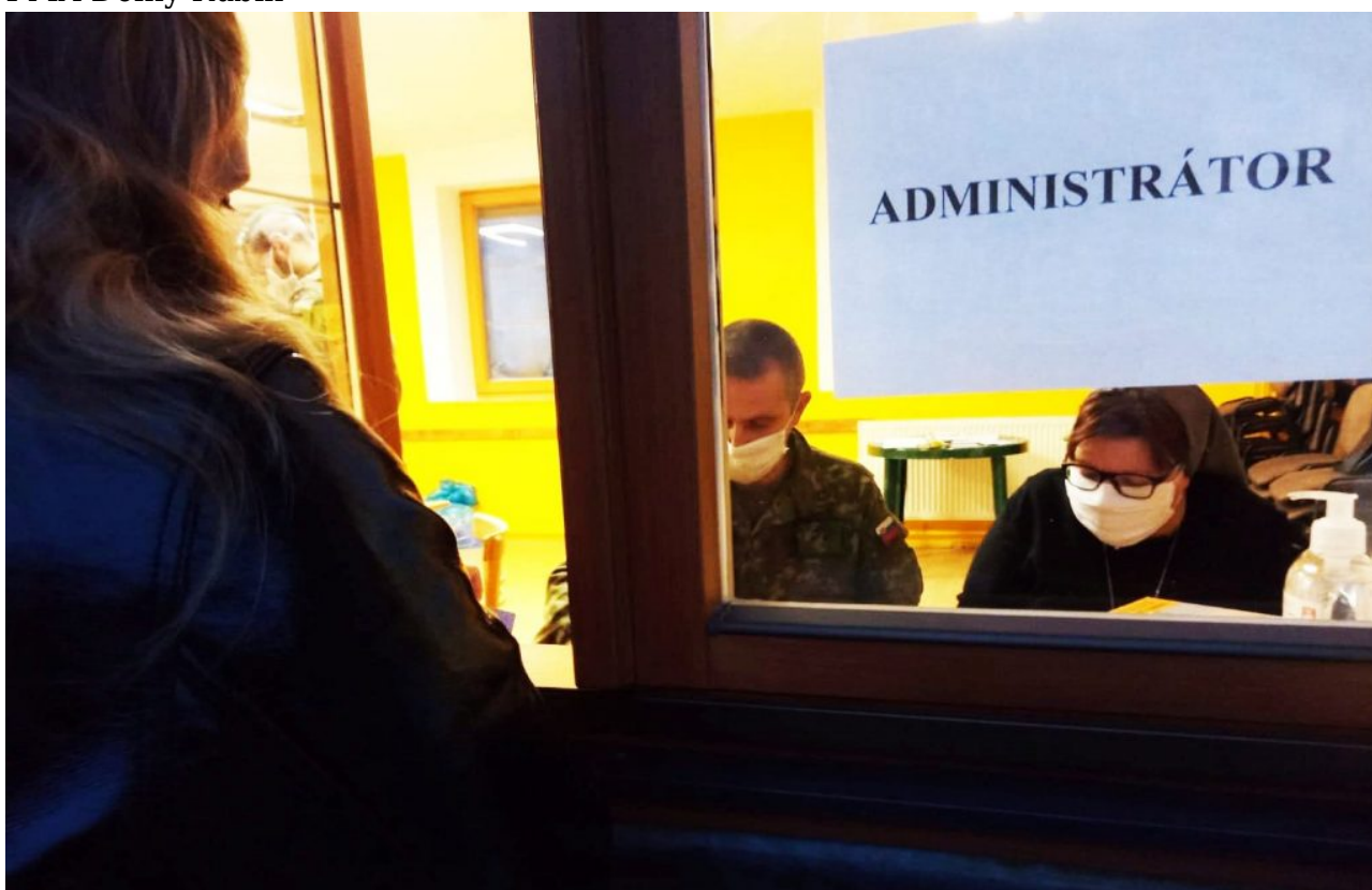
FMA Dolný Kubín