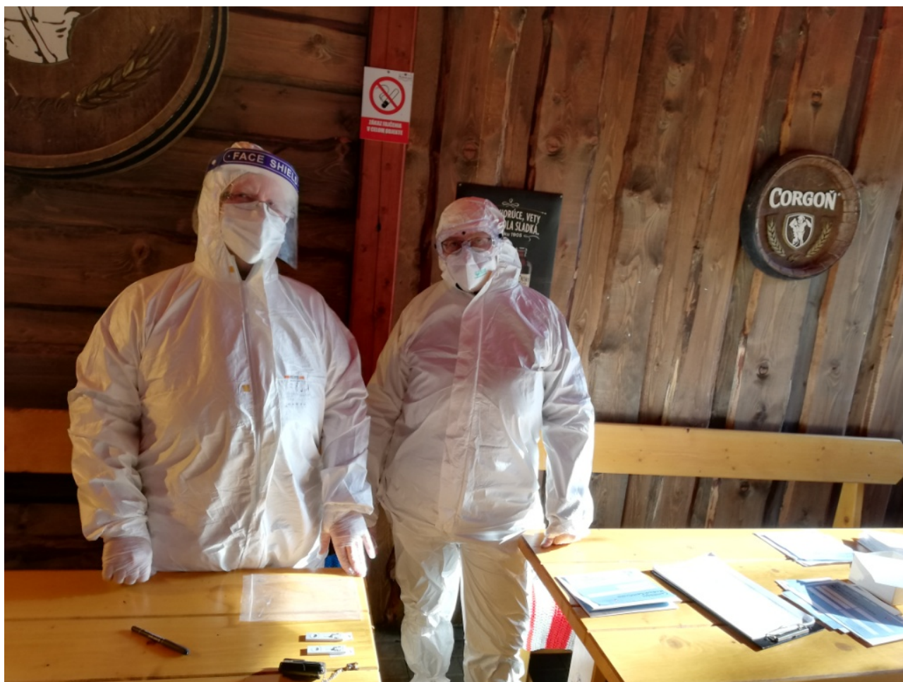
SMVS L. Mikuláš

Testovanie na niekoľko dní zjednotilo habit slovenských rehoľníkov