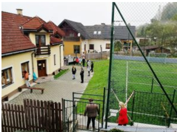
FMA Dolný Kubín

Testovanie na niekoľko dní zjednotilo habit slovenských rehoľníkov