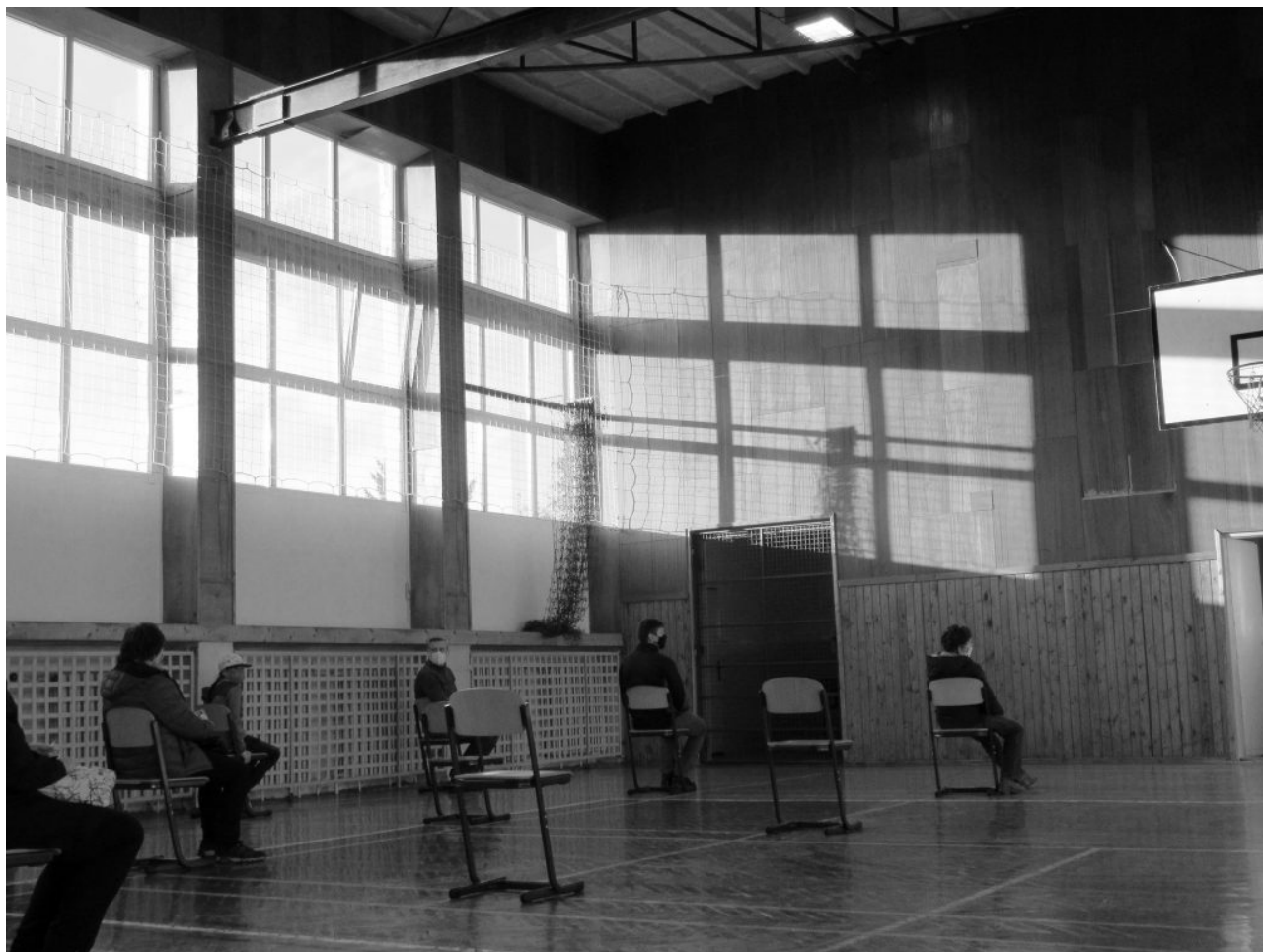
• SDB Žilina

Testovanie na niekoľko dní zjednotilo habit slovenských rehoľníkov