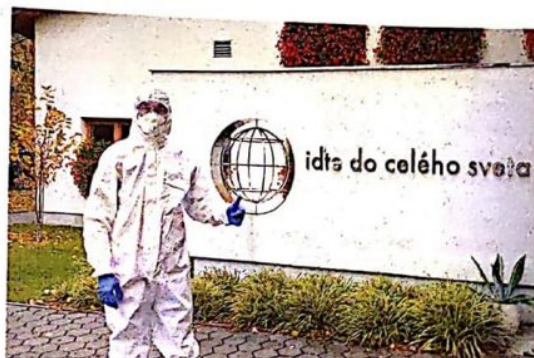
Odberné miesto bolo i pri Misijnom dome sv. Arnolda Janssena v Petržalke. Ako dobrovoľníci sa do služby prihlásili dvaja pátri a jeden seminarista, no pomocnú ruku podali aj ďalší členovia komunity misijného domu.

Jedno z odberných miest v Petržalke bolo na parkovisku pri Misijnom dome sv. Arnolda Janssena. Verbisti okrem priestoru ponúkli i dobrovoľnícku službu. Už od skorého sobotného rána sa tam tvorili dlhé rady čakajúcich, no všetko napriek niekoľkohodinovému čakaniu prebiehalo bez väčších konfliktov. Možno