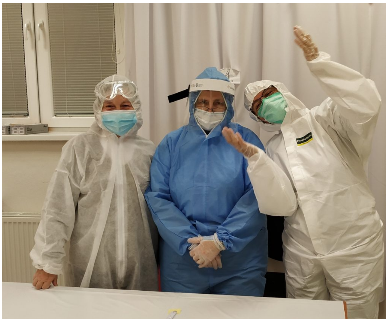
• OP Petrovany