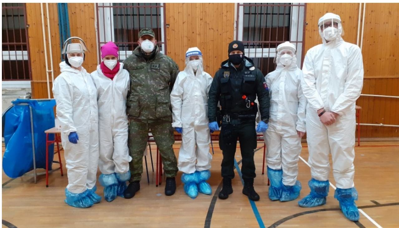
• ŠSND Piešťany